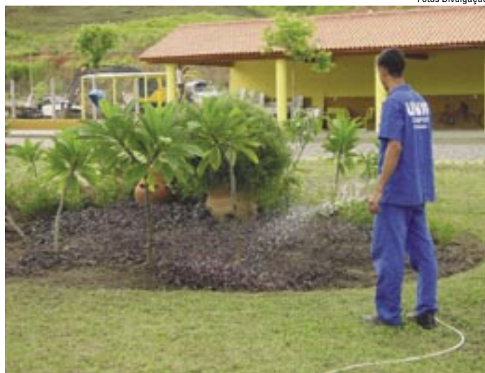
Prédio da Unig, em Itaperuna, tem sistema de captação de água pluvial, utilizada na irrigação dos jardins da universidade