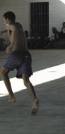
Ao lado, jovens jogam bola no Instituto Padre Severino, unidade do Degase na Ilha do Governador. Acima, detentos em cela da Polinter: emendas para melhorar o sistema