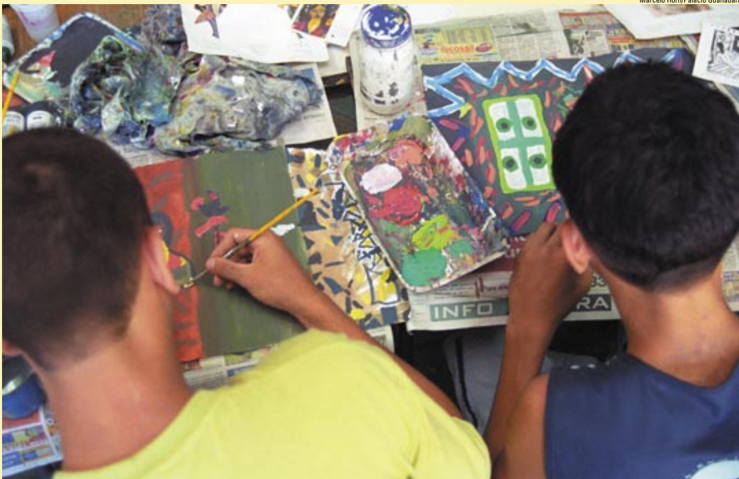
No Criad de Nova Iguaçu, jovens desenvolvem atividades lúdicas: propostas de ressocialização devem ser incrementadas