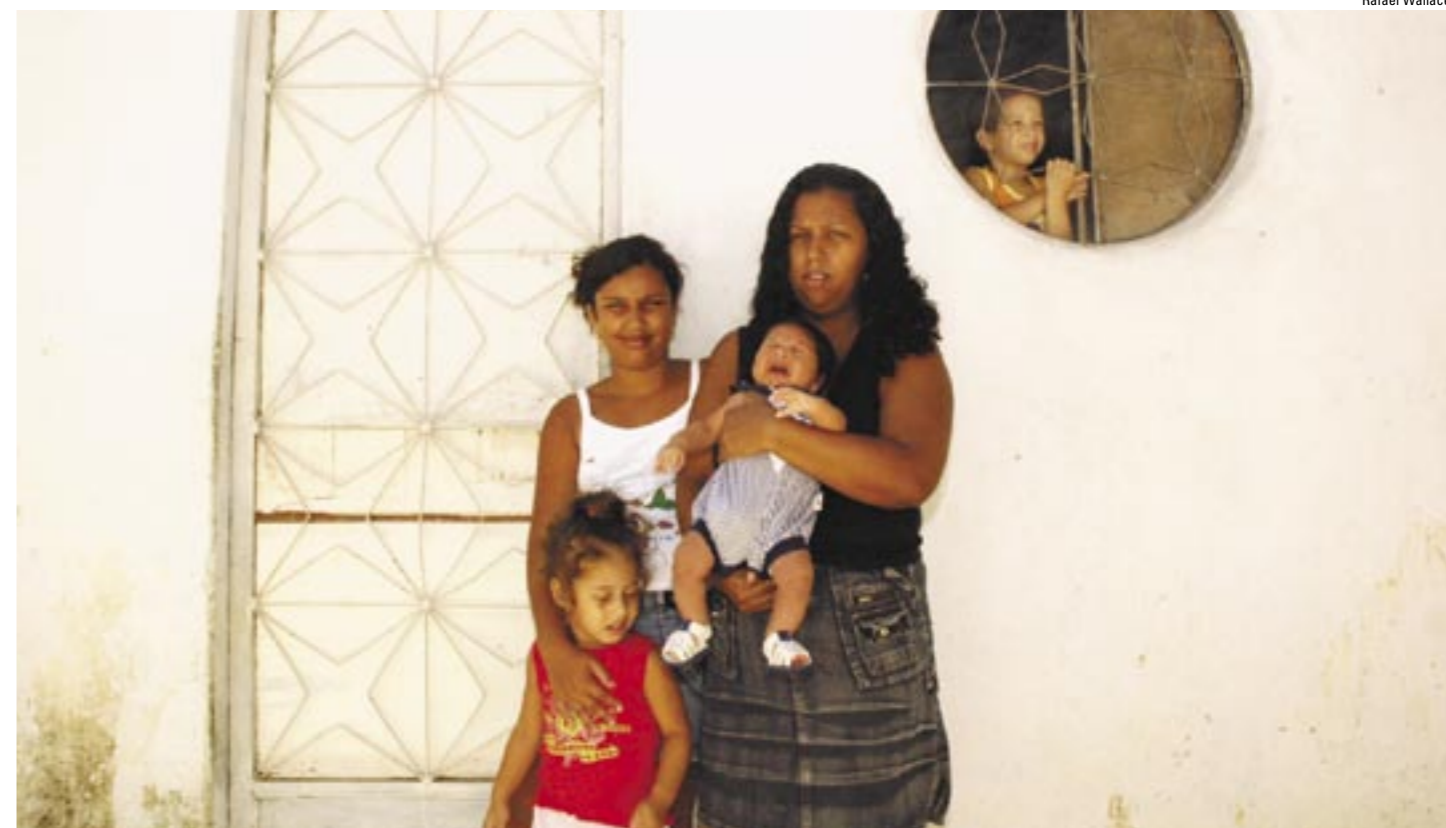
Simone queria ter só um filho. Aos 29 anos, com três, sonha em realizar a laqueadura e dar melhores condições à prole

A assessoria da Secretaria Municipal de Saúde do Rio de Janeiro confirmou que, para realizar a laqueadura imediatamente após o nascimento do bebê, as mães precisam assinar um termo pelo menos 70 dias antes da sua realização e assistir às palestras. Ainda segundo a assessoria, nos casos de laqueadura sem gravidez, a demanda é muito grande, o que ocasiona filas de espera. Para amenizar o problema, a secretaria está elaborando um projeto para aumentar as vagas.