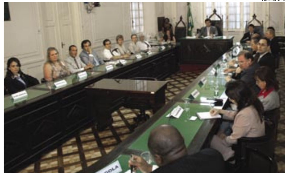
A comissão enviará um relatório ao Ministério do Turismo com as sugestões dos cônsules