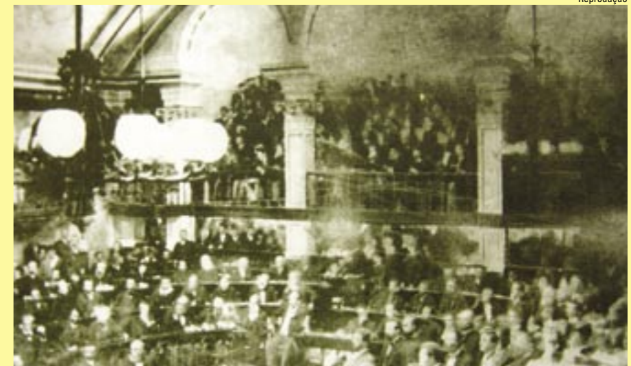
No Império, o Parlamento foi o principal palco de mudanças do século XIX

Parlamento é, há muito tempo, o local onde as transformações se concretizam